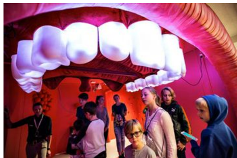
Efter entrén under tandraden startar resan genom kroppen.