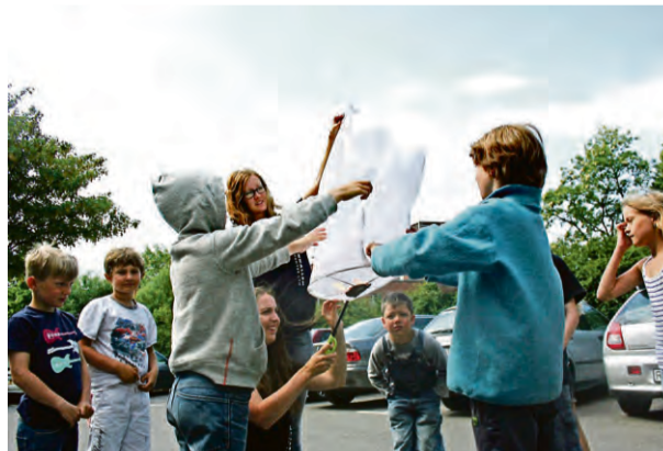
LUFTBALLONGEN ville inte riktigt flyga iväg.

– Du får väldigt mycket bra frågor från barnen och man kan resonera kring varför saker och ting händer. Det blir en dialog där vi tillsammans kan resonera och fundera. Förhoppningsvis kan det trigga barnen att bli intresserade men också ändra uppfattningen om vad som är naturvetenskap. I en ände av korridoren sit-